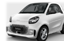
Smart Fortwo – Electric EQ 60kW Passion

CANONE 36 mesi con manutenzione ordinaria e straordinaria 329 € mese 36 mesi 45 mila Km