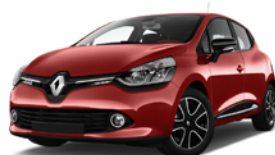
Renault CLIO – Benzina 1.0 TCE 74KW BUSINESS

CANONE 36 mesi con manutenzione ordinaria e straordinaria 249 € mese 36 mesi 45 mila Km