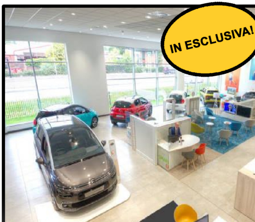
Salonisti, Dealer, multimarca