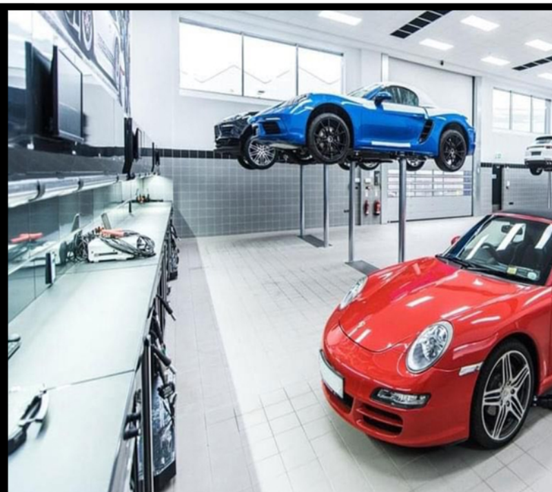
Officine, gommisti, elettrauto