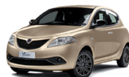
Lancia Y – Hybrid 1.0 70cv S&S Hybrid Gold

CANONE 48 mesi con manutenzione ordinaria e straordinaria 255 € mese 48 mesi 60mila Km