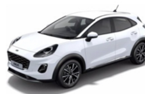
Ford Puma – Hybrid 1.0 Ecoboost Hybrid 125CV Titanium

CANONE 36 mesi con manutenzione ordinaria e straordinaria 275 € mese 36 mesi 45 mila Km