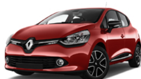
Renault CLIO – Benzina 1.0 TCE 74KW BUSINESS

CANONE 48 mesi con manutenzione ordinaria e straordinaria 229 € mese 48 mesi 60mila Km