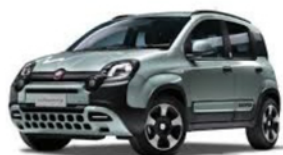
Fiat Panda – Hybrid 1.0 70cv S&S Hybrid Easy

Le offerte 36 mesi ad anticipo zero e al netto di iva